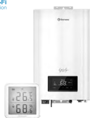
Электрические котлы и комнатные термостаты