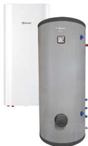
Комбинированные (косвенные) водонагреватели